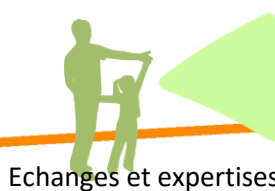
Echanges et expertises